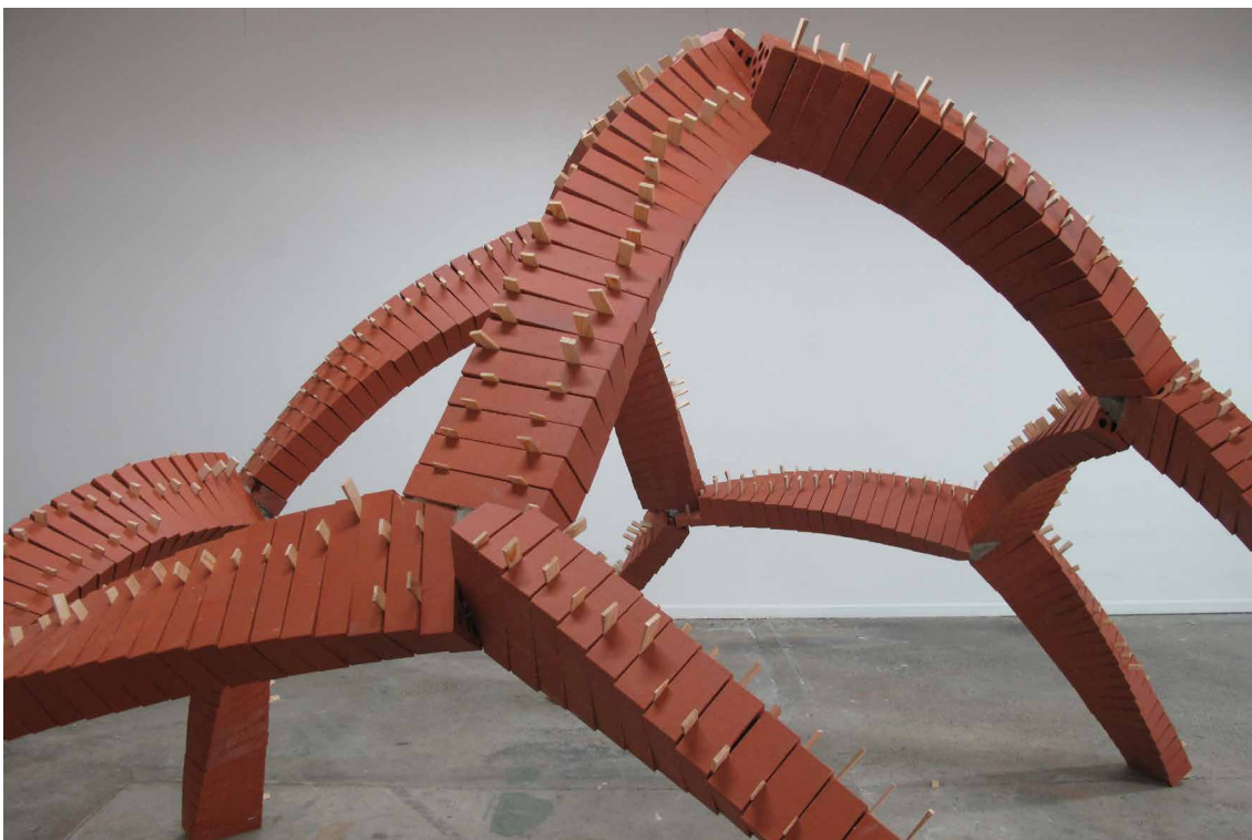
Vincent Ganivet, PC.3.1.3 , 2017 4,5m, polystyrène, Atlas & Axis, Instant Chavirés