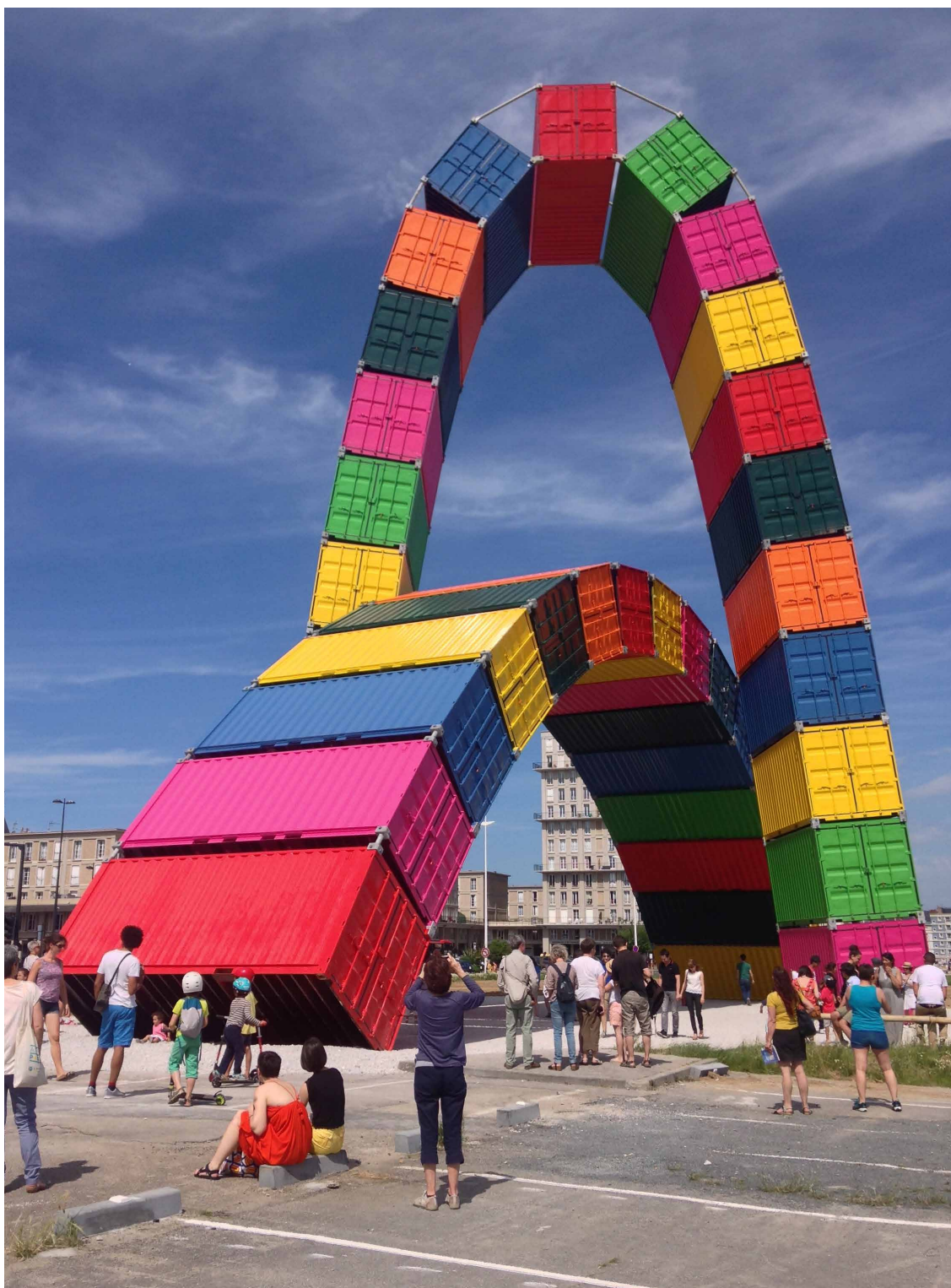
Vincent Ganivet, Catène de containers , 2017

2 arches constituées de 36 containers de 20 pieds, la plupart structurés (acier) et lestés (béton)