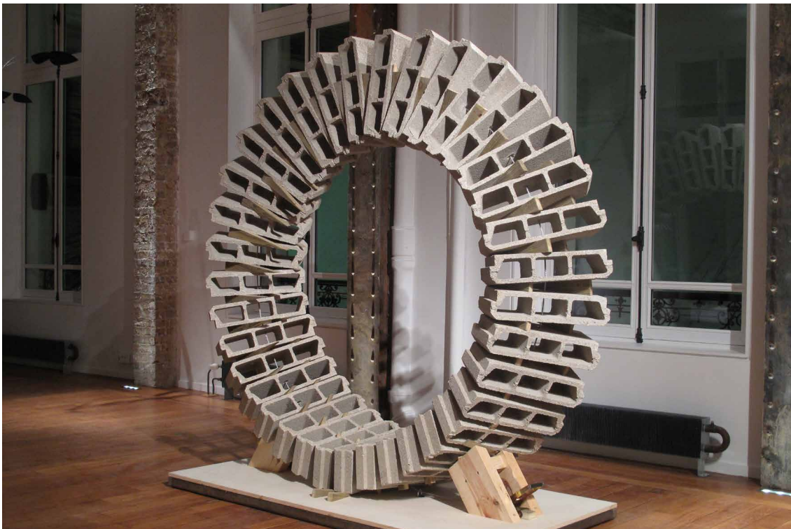
Vincent Ganivet, Polyorcétie , 10×5×8,5m, hourdis, 2012 Rêve de monuments, CNM, Forteresse de Salses