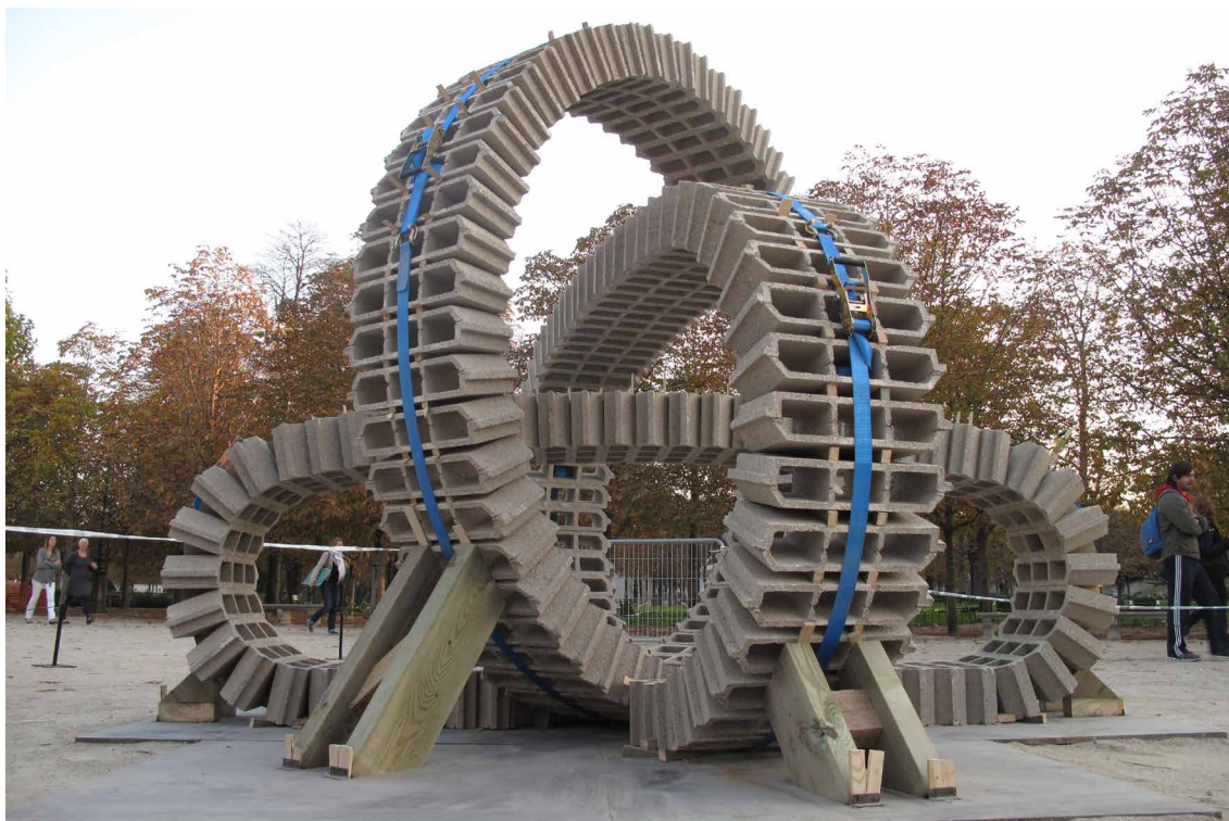
Vincent Ganivet, Entrevous , 2010 5m, hourdis, Collection Lambert Avignon