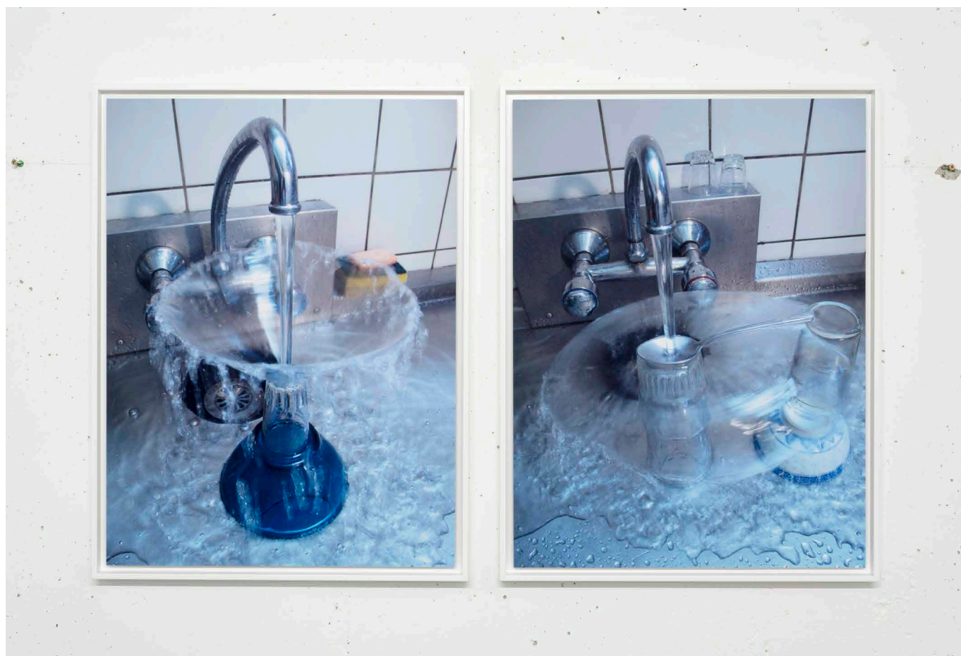
Vincent Ganivet, « Vaisselle », Arnaud Deschin galerie, 2017