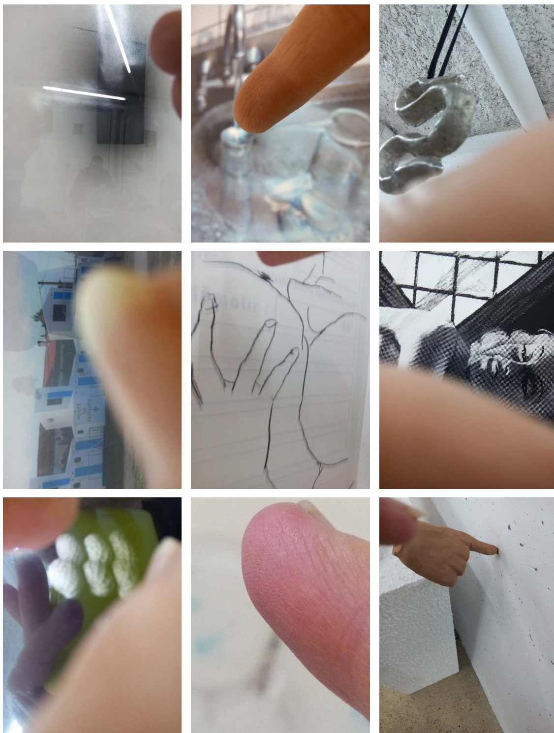
Sophie Boursat, L'art de toucher du doigt , 13×18 cm chaque, un voyage dans l'exposition "SUR RENDEZ-VOUS" Commissariat Arnaud Deschin

ARNAUD DESCHIN GALERIE • 16-18 RUE DES CASCADES 75020 PARIS • +33 (0)6 75 67 20 96 INFO@ARNAUDESCHINGALERIE.COM • WWW.ARNAUDESCHINGALERIE.COM