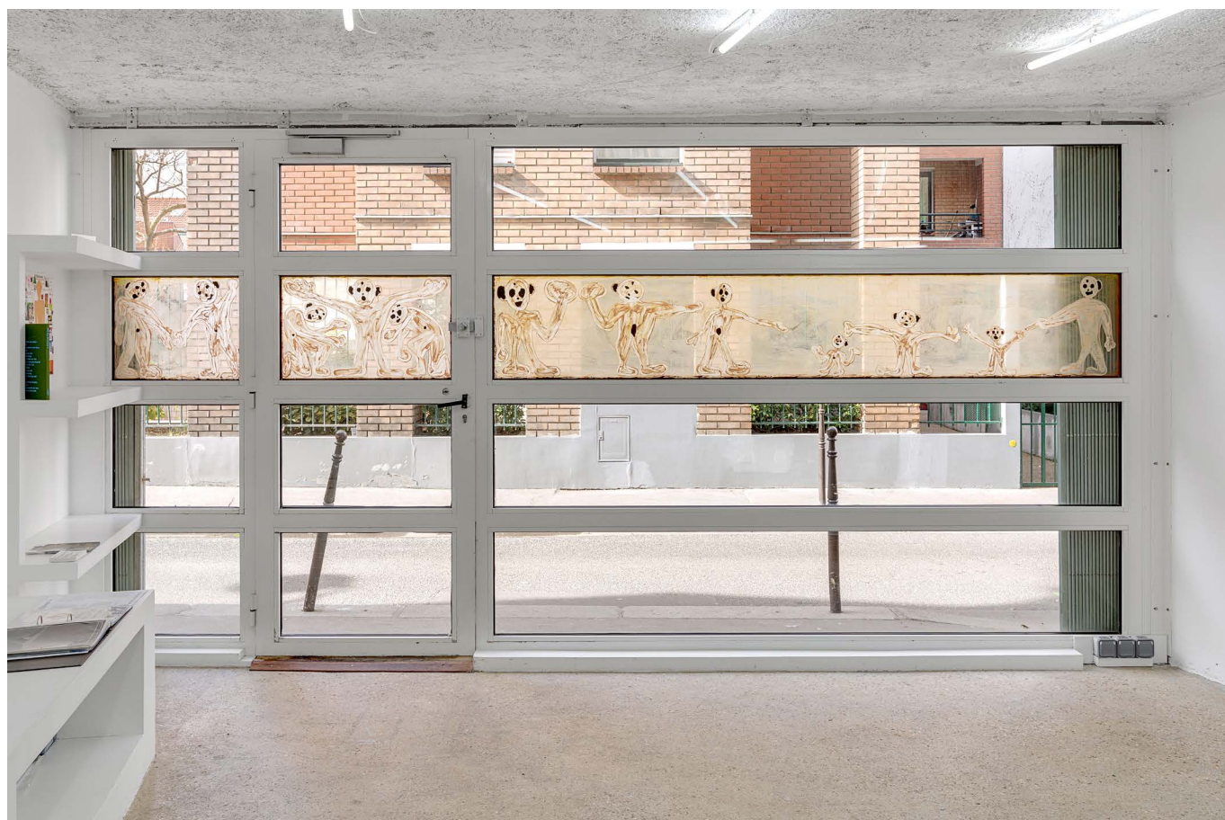
Arnaud Deschin galerie, 2017

– Prise de RDV : +33 6 75 67 20 96 ou rdv@arnauddeschingalerie.com